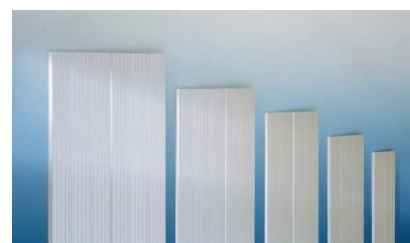
Des rampes de largeurs et longueurs différentes